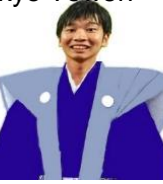
Sixth general Tokugawa Ieyoshi (D.T)