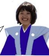
First general Tokugawa Ieyasu (Y.H)

Here is a statue that I made for a celebration! It is now a famous spot, crowded with many people! ここにはわしの還暦を記念して作らせた寿像が置いてある! 今はパワースポットになっていて、多くの人で賑わっているな〜!