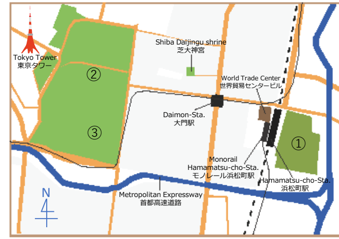
Current map 現在の浜松町駅周辺

私たちが浜松町のフィールドワークで感じたことは、1.歴史的な建物が多く、それらが景観として高層ビルとうまく融合している、2.外国人観光客が多い、3.羽田空港から近い、という3点でした。そこで、私たちはこの3点を強みと捉え、浜松町にゆかりのある徳川家と、この土地の今と昔を比較することで、浜松町から日本の歴史の魅力を感じてもらおうと考えました!