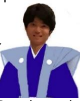
Second general Tokugawa Hidetada

I used to see Mt. Fuji from this place and drink tea. Now it's a date spot! 昔はここから富士山を眺めてお茶したな〜。今はデートスポットになっているのか!